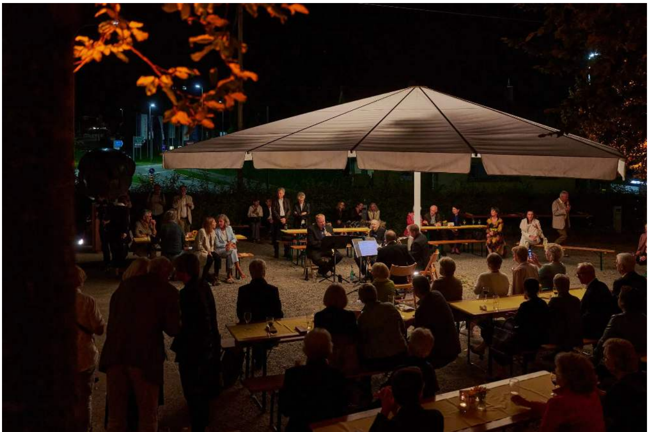
Entspannte Open-Air-Stimmung: ein Konzert bei den Appenzeller Bach-Tagen.

Wird das alles unsere Zukunft sein, eine eigene schöne neue Welt? Ähnlich gegenwartsbezogen ging es in «Bachs Werkstatt» in Appenzell zu. Zum zehnten Jubiläum der dortigen Bach-Tage wagte man den Blick in die Komponierstube des Meisters, um Bearbeitungen Bachs von Musik aus eigener und fremder Feder zu durchleuchten oder das damals gängige Parodie-Verfahren der Umwidmung fremder und eigener Kompositionen nachzuvollziehen. Bei diesem Verfahren wurden in der Regel präexistente Musikstücke umgewandelt, um für sie mit geänderten Inhalt neue Nutzungsmöglichkeiten zu erschliessen.