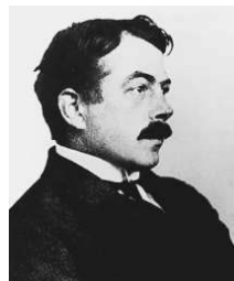
Der Schriftsteller Robert Walser (1878–1956).

einer Wanderung bei Herisau einen Herzschlag und wurde tot im Schnee gefunden. Abgesehen von dieser biografischen Zufälligkeit geben andere Texte aufschlussreiche Einblicke in sein Leben. Wunderbar etwa ist